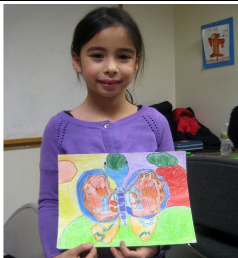
安吉同学，九岁，三年级