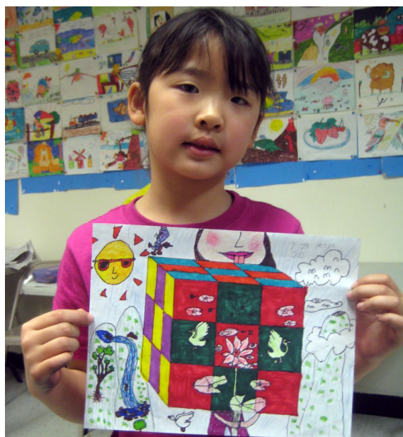
安雅同学，七岁，二年级